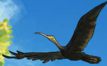
សត្វគ្រយង