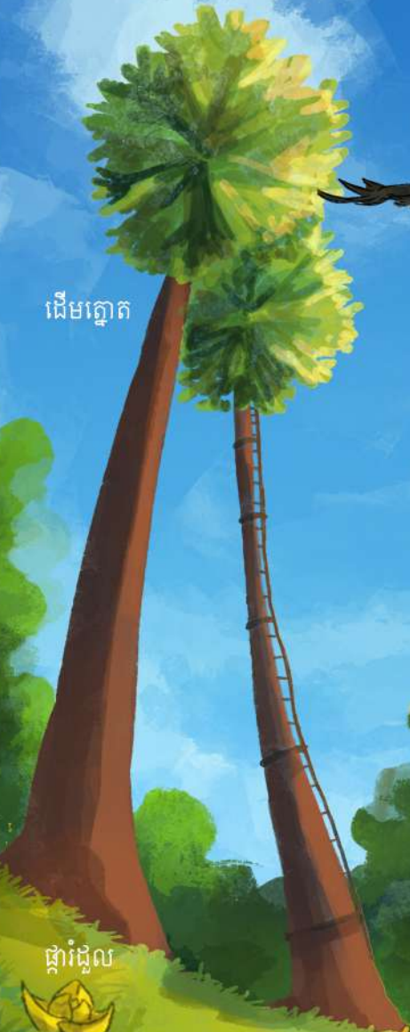
ផ្កាផ្ទៃល